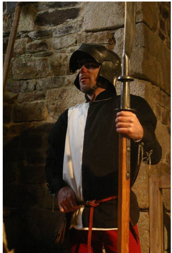
Livrée « My-parti »

Le livre des tournois montre des badges de poitrine d'hermine plain pour les gens du Duc. La garde bénéficiait elle d'étoffe de luxe fortement brodées ou « jaquette d'orfèvrerie » ou d'argenterie rehaussée d'une cordelière en fil d'or de Venise. Les broderies de ces jaquettes avaient sûrement des formes très précises mais inconnues (des épis seraient intellectuellement séduisants !) et devaient courir sur les croix noires (comme l'évoque l'enluminure déjà citée de la rencontre de la Roche Derrien). Il est possible que les bordures des tenues de livrées soient galonnées en couleurs.