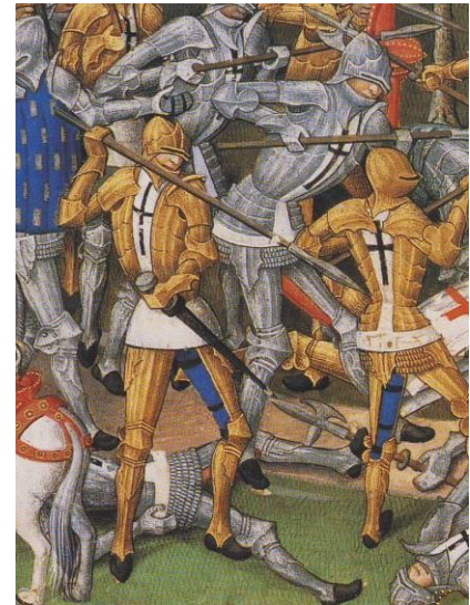
Combat de la Roche Derrien

Ou comment être reconnu en portant en vêtement de dessus les « vestures délivrées » par les commissaires ducaux lors des montres ! Nous n'aborderons pas ici les tenues spécifiques des hérauts et poursuivants.